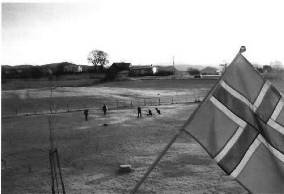
Nydelig vinterstemning på Bjørnefjorden.

Det blei nedsett dugnadsansvarleg for kvar banetrase, noko som fungerte godt.