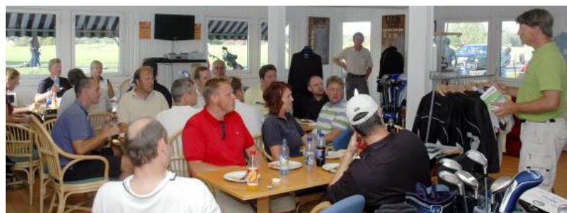
HYGGELIG RESTAURANT: Her er det middag med premieutdeling for bakkemannskapet til SAS Braathens som nettopp har fullført en konkurranse.

At klubben vil lykkes i å realisere planene er vi ikke tvil om. 🍷