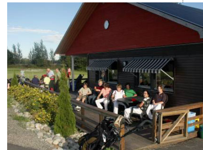
HYGGELIG MIDTPUNKT: Et oppgradert klubbhus er populært samlingssted på golfbanen.