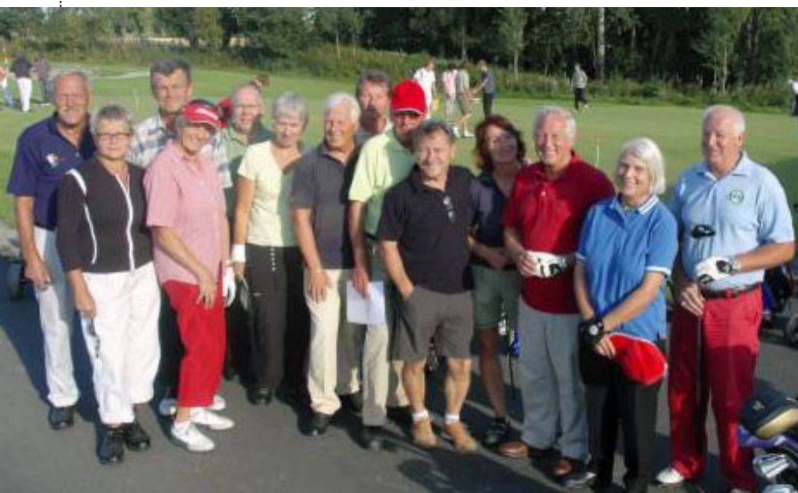
UKENTLIG: Seniorgruppen møtes en gang i uken til hyggeturnering med sosialt samvær og premieutdeling i klubbhuset.