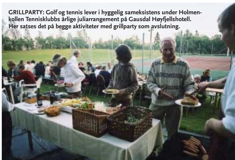
GRILLPARTY: Golf og tennis lever i hyggelig sameksistens under Holmenkollen Tennisklubbs årlige juliarrangement på Gausdal Høyfjellshotell. Her satses det på begge aktiviteter med grillparty som avslutning.

hvorav 150 under 17 år Medlemskontingent: Voksen kr 2000,- 0-17 kr 800,- Studenter, 18-21 kr. 1200,- 67+ Kr 1800,-