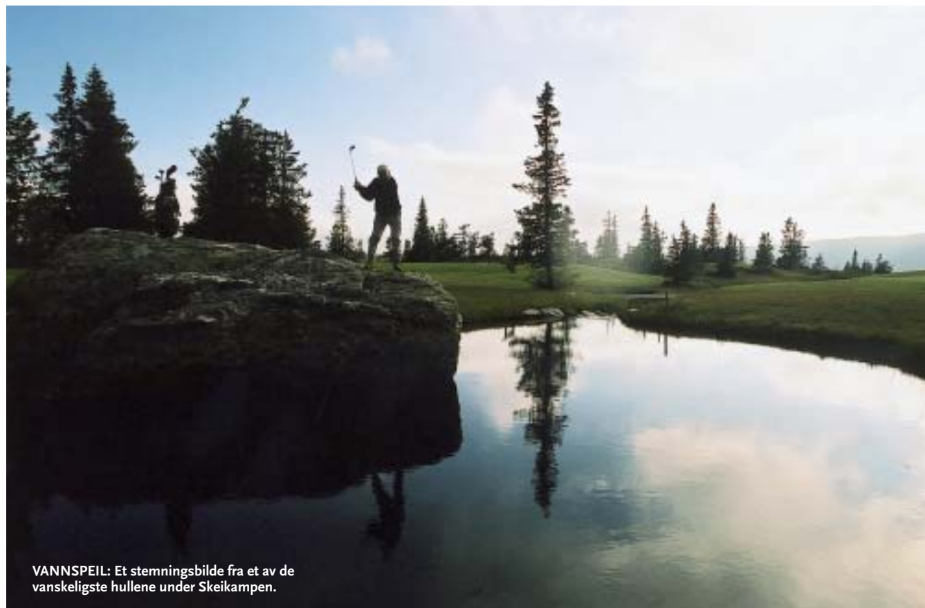
VANNSPEIL: Et stemningsbilde fra et av de vanskeligste hullene under Skeikampen.