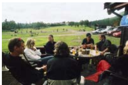
BORDET FANGER: En golfrunde kan avsluttes med en hyggelig lunsj på restauranten med utsikt over treningsfeltet og Gausdal Høyfjellshotell i bakgrunnen.