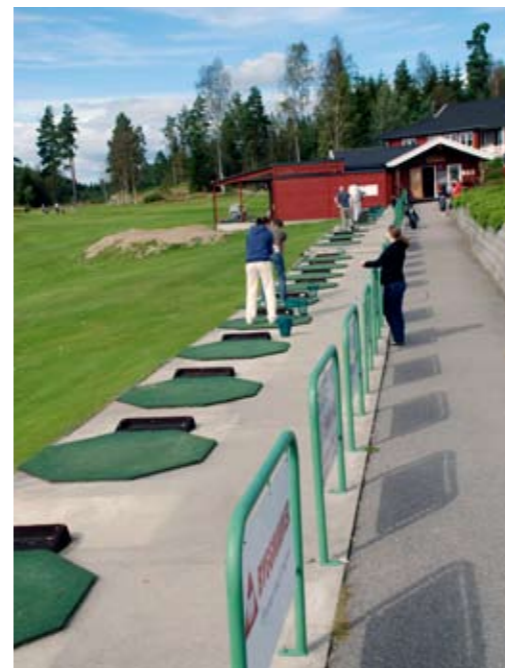
STRATEGISK PLASSERT: Proshopen har nærkontakt med både bane, restaurant og treningsområder.