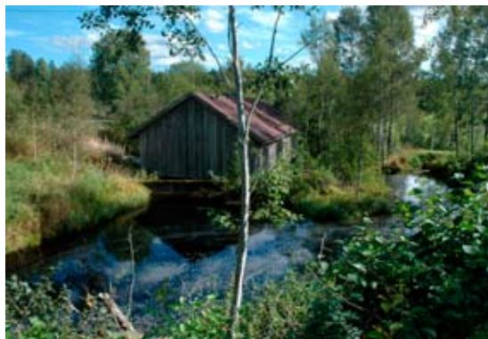
VERNEVERDIG: Rammesagen fra rundt 1580. Den ligger ved Mørkbekken som du passerer på vei mot hull 4. Den var i bruk helt til 1950, og hadde fra starten «Kongelig sagbruksbevilgning for eksport» fra Det Kongelige Slott i København.