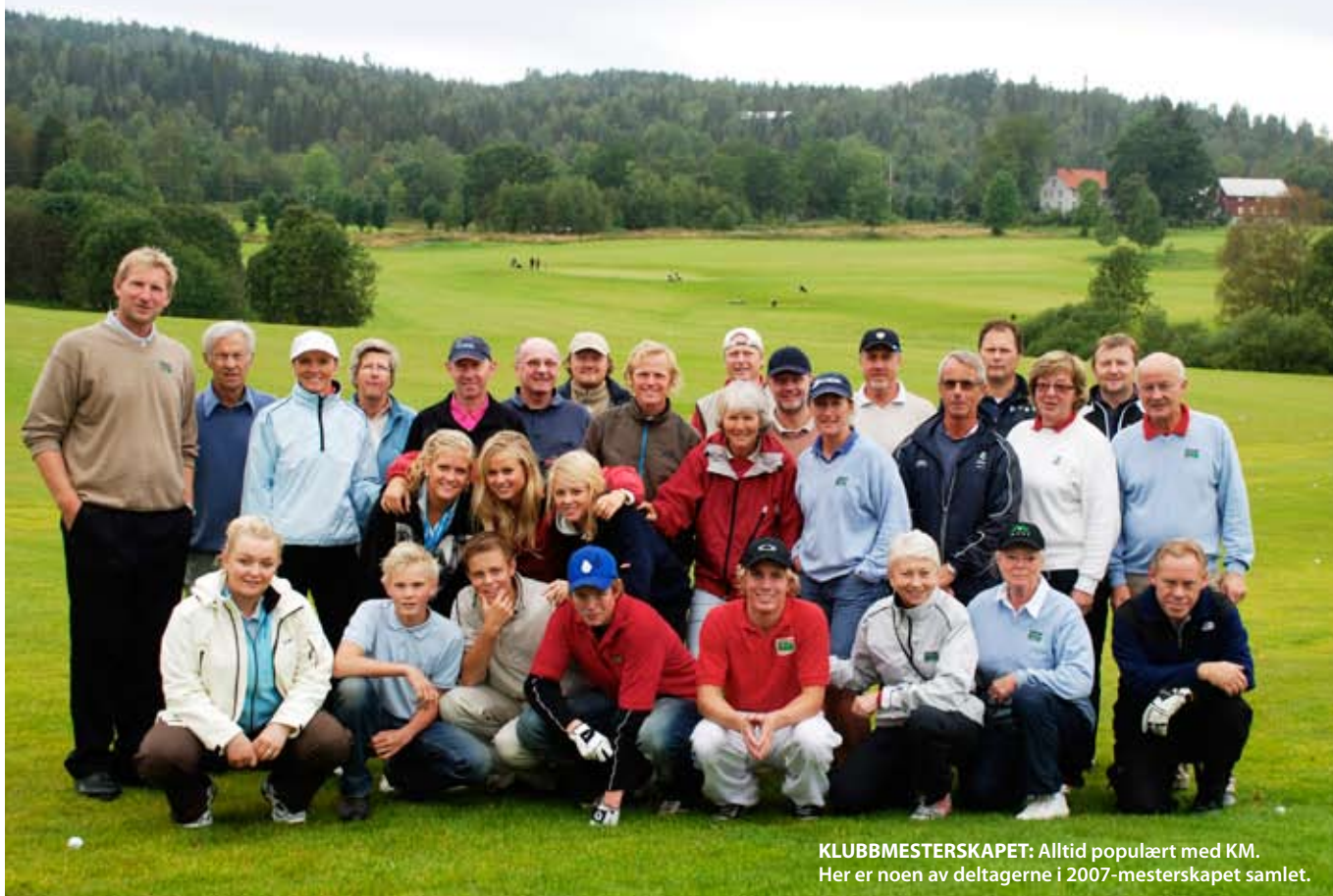
KLUBBMESTERSKAPET: Alltid populært med KM. Her er noen av deltagerne i 2007-mesterskapet samlet.