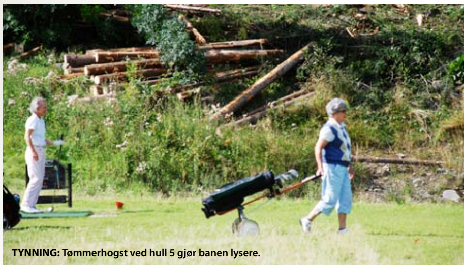
TYNNING: Tømmerhogst ved hull 5 gjør banen lysere.

Signaturhullet. Banens stolthet. Svak dogleg. En del trær kan skape vanskeligheter med å komme inn på ett slag. Fire bunkere i forkant.