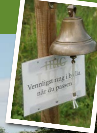
BJELLE: Bruk den når du forlater hull 8.