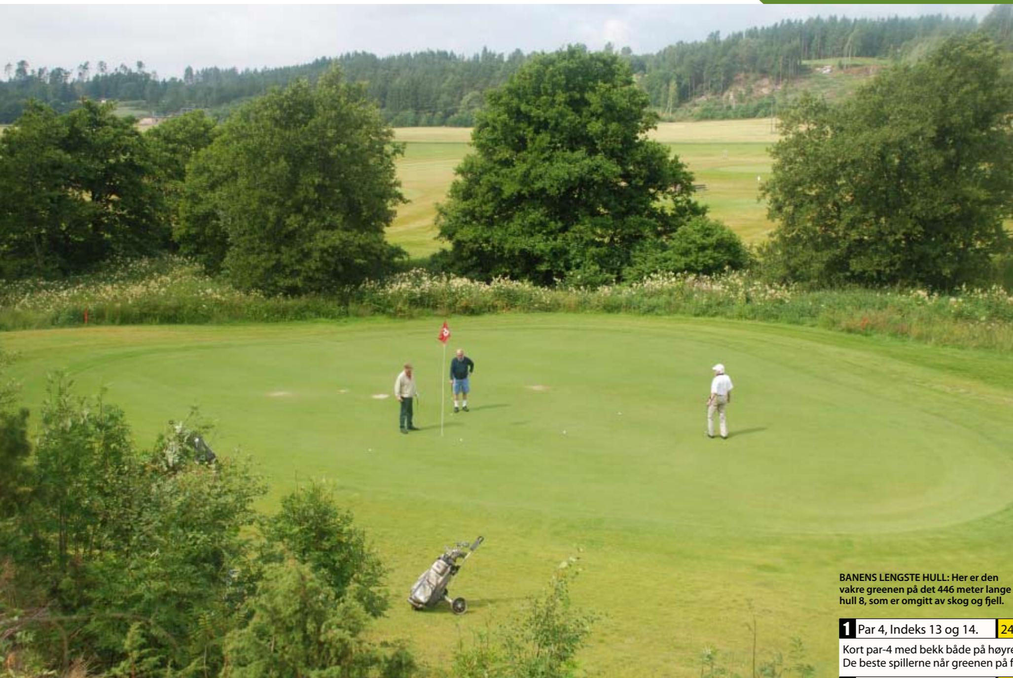
BANENS LENGSTE HULL: Her er den vakre greenen på det 446 meter lange hull 8, som er omgitt av skog og fjell.