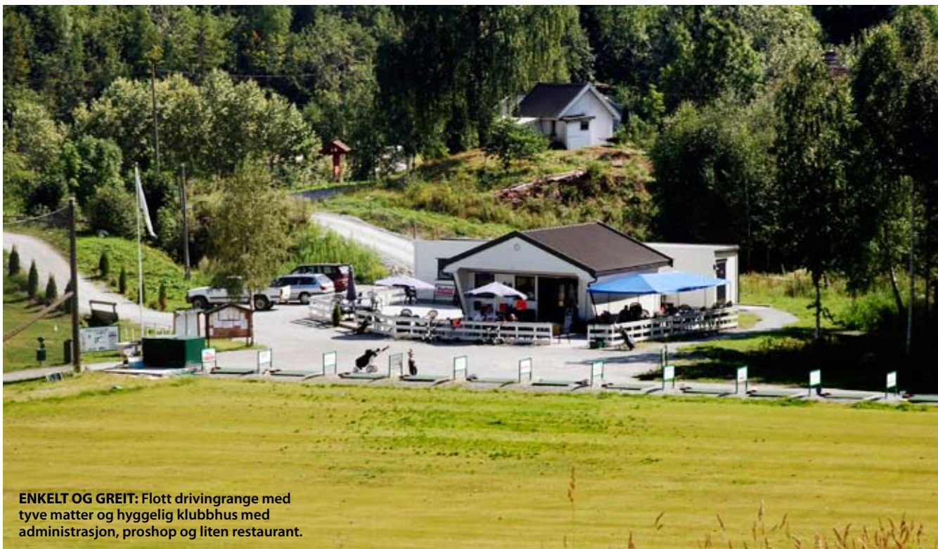
ENKELT OG GREIT: Flott drivingrange med tyve matter og hyggelig klubbhus med administrasjon, proshop og liten restaurant.