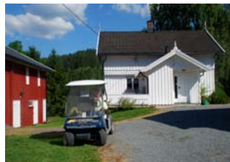
PORTÅSEN KULTURSENETER: Nedre Eiker kommune skal skape kultursenter av Herman Wildenveys gamle hjem, som er nabo til golfbanen.