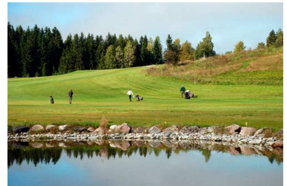
TOREDAMMEN: Spillerne på vei opp hull 6.