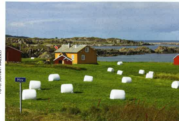
NORDSIDEN: Hov Gård ligger ved Hov på Gimsøy på nordsiden av Lofoten. I tillegg til golfbanen har gården også en populær campingplass.