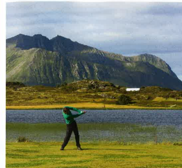
HØYT RANGERT: Sammen med Miklagard Golf (Kløfta), Oslo GK (Bogstad) og Holtmark Golf (Sylling), er Lofoten Links banen som rangeres høyest av golfbanene i Norge.