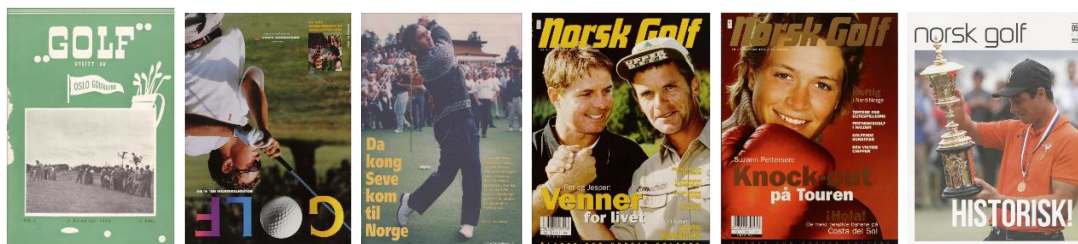
Diverse utklipp og forsider av norske golfmagasiner

78-åringen er leder av faggruppen, og har stått i bresjen for å gi folket muligheten til å digitalt bla i tusenvis av sider med norsk golfhistorie.