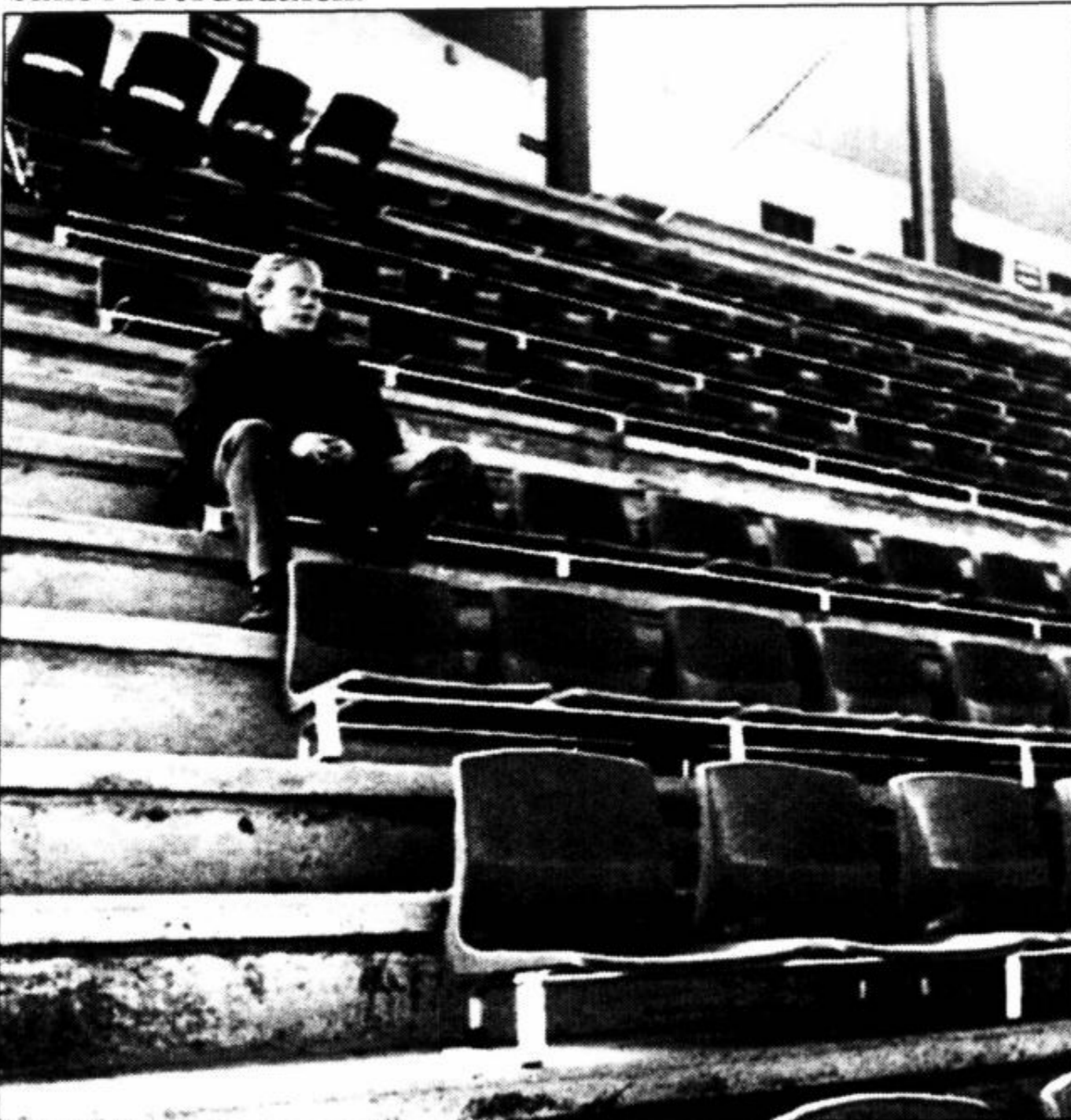
PÅ STEDET HVIL: Jordal Amfi holder ikke lenger internasjonal standard. Nei til utbedring vil bety nei til B-VM i ishockey for Norge.

Først reduserte Oslo bystyre idrettens budsjett for 1986 med 10 millioner kroner. Deretter står Aps Thorvald Stoltenberg fram i et foredrag og foreslår bygging av en golfbane i Groruddalen.