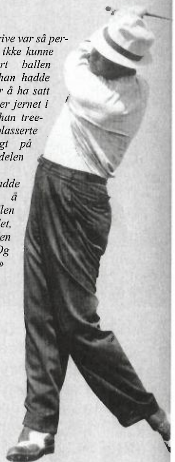
«Guldahl var nest-best i alle golfslag, men til sammen var han best i golf!» Byron Nelson sa dette om Guldahl etter seieren i US MASTERS 1939.

Guldahls drive var så perfekt at han ikke kunne ha plassert ballen bedre om han hadde prøvd. Etter å ha satt ned igjen 4er jernet i bagen tok han tree-ren og plasserte ballen trygt på den bakre delen av greenen. Alt han hadde igjen var å skubbe ballen nærme hullet, og tappe den for par 4. Og det var det.»