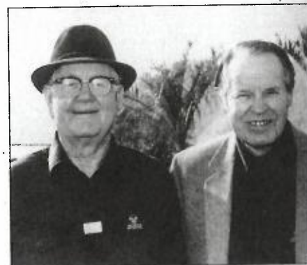
Legender. To legender og to gode venner samlet på Augustabanen en gang på 1970-tallet. Byron Nelson og Ralph Guldahl.

«Guldahl var en hedersmann og gentleman i all sitt vesen og han hadde helt starten en fin, oppdragende virkning på medlemmene i klubben vår. Hans mot-