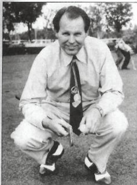
Seierssmilet. Guldahl på toppen av sin karriere. Bildet er tatt etter US OPEN-seieren 1938.