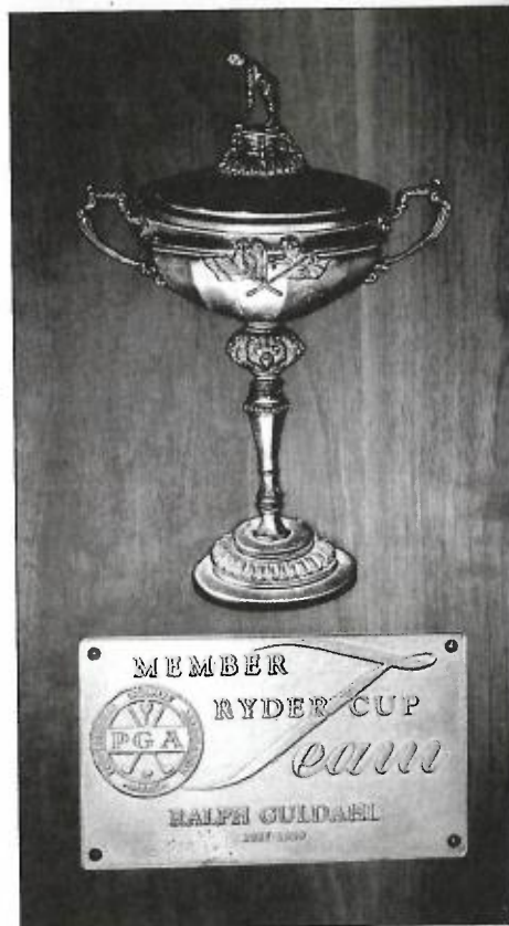
Ryder Cup-beviset. I Guldahl-restauranten henger beviset på at Ralph Guldahl var med i Ryder Cup 1937 og tatt ut også til konkurranse i 1939. Krigsutbruddet satte en stopper for det og da Ryder Cup tok til igjen etter krigen i Portland i 1947, var det fem år siden Guldahl hadde lagt opp konkurransegolf.

Braemar Country Club er en vakker og eksklusiv klubb med store tennisanlegg, store velferdsrom og restauranten GULDAHL GRILL ROOM. Den 17. april hvert år er den årlige Guldahl-dagen og etter noen dagers vandring blant klubb-